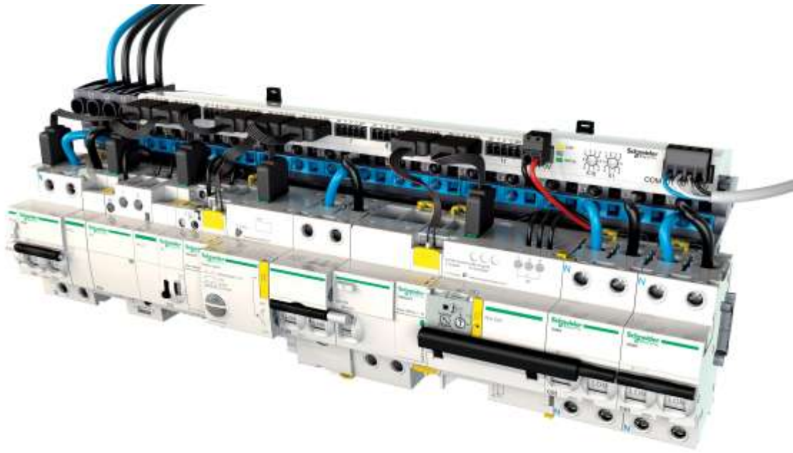
Multiclip - Sistema de distribuição com derivação por cabos