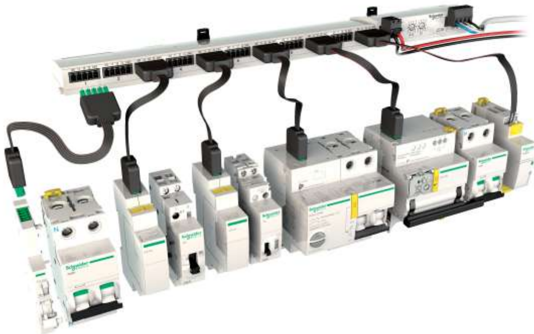
Smartlink - Exclusivo sistema de comunicação em rede